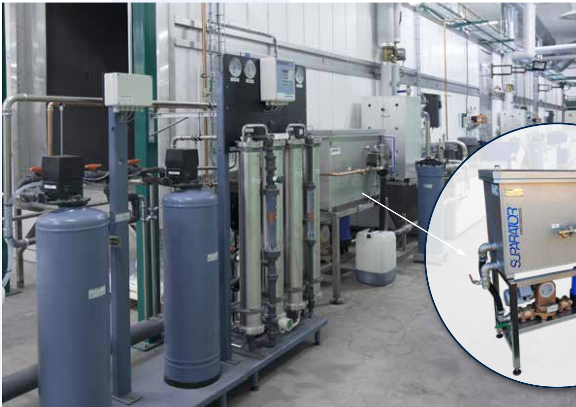
Suparator® dynamisches Ölabscheidungssystem Typ 86/240. Typisches Beispiel für die modulare Integration in eine automatische Lackieranlage.