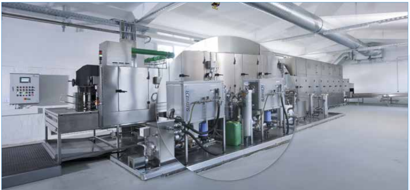
Zwei Suparator®-Ölabscheidungssysteme vom Typ 86/240, integriert in eine Tunnelwaschanlage die Teilereinigung.