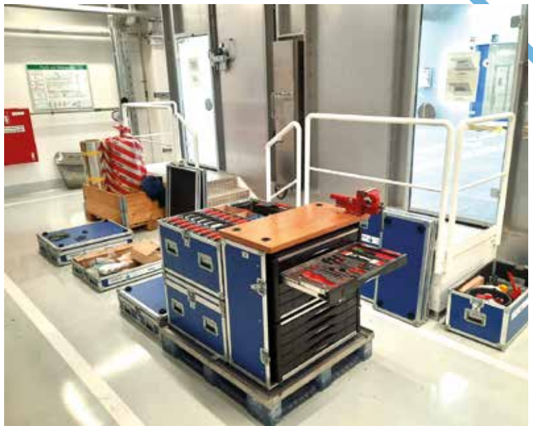
Maintenance Flight Case System mit Werkzeugen und Ersatzteile.

Unsere Kompetenz bezieht sich nicht nur auf unsere Produkte und Lösungen. Sie finden es auch in der Art und Weise, wie wir über Service und Wartung denken. Remote-Support zum Beispiel. Sie können uns jederzeit über unser Service Desk oder unser Serviceportal kontaktieren. Wir registrieren Ihre Supportanfrage und verfolgen den Fortschritt bei der Lösung des Problems genau. Wir bieten Wartung auf Abruf an, aber auch ein präventiver Wartungsvertrag ist eine Option. Eine solche maßgeschneiderte Vereinbarung, die auf festen Terminen basiert, ist für eine konstant optimale Produktivität und geplante Verfügbarkeit unerlässlich und entlastet Ihre Wartungsabteilung. Wir behalten den Überblick über Ihre geplanten Termine. Zusätzlich bringen unsere erfahrenen Fachingenieure unser Maintenance Flight Case System mit. Dabei handelt es sich um eine umfassende Ausstattung, die alle erforderlichen Werkzeuge, Verschleißteile und strategischen Teile enthält.