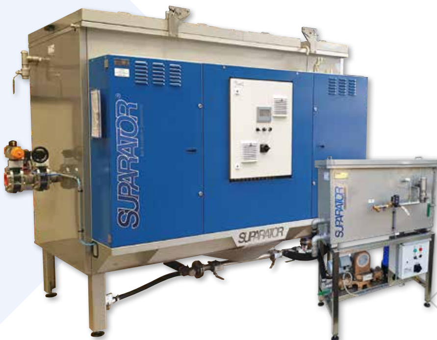
Suparator® dynamische Ölabscheidungssysteme sind in vielen verschiedenen Größen erhältlich. Oben zwei Beispiele; Typ 88/3000 Package Unit (links) für die Behandlung großer Mengen, wie sie in der Automobilindustrie verwendet werden, und Typ 86/240 (rechts) für kleinere Mengen.

Den Suparator® für Maschinenhersteller besonders attraktiv zu machen, haben wir eine spezielle sogenannte OEM-Version. Dabei handelt es sich um Set, das ein Suparator®-System enthält, jedoch ohne Steuerungssystem und Gestell. Dies erleichtert die Integration unserer Teile in Ihre Maschine mithilfe vorhandener Einrichtungen wie z.B. des Steuerungssystems. Wir beraten Sie, wie dies am besten funktioniert, und stellen die notwendigen Informationen zur Verfügung. Auf diese Weise stellen wir Ihnen unser Know-how zur Verfügung und übernehmen die Verantwortung für das Ergebnis. Weniger ist mehr.