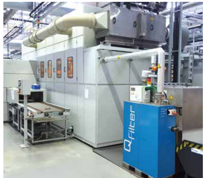
Q-Filter® Aktiver Vakuumfilter Typ QF150, integriert in eine Präzisionsteilereinigungsmaschine.

Entwicklung endet nie; Es gibt immer Optimierungsmöglichkeiten oder bessere Alternativen. Wir entwickeln