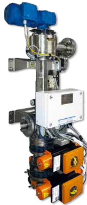
Q-Mag® Vollautomatischer selbstentleerender Magnetscheider