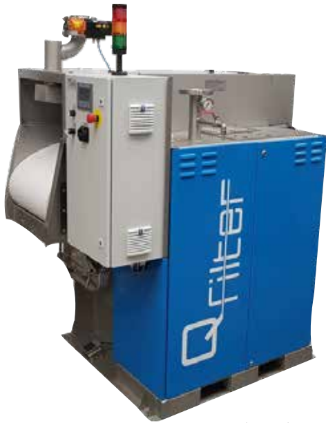
Q-Filter® Aktiver Vakuumfilter Typ QF150 zur Filtration bis zu 5 µm.