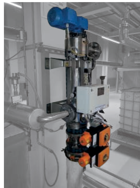
Q-Mag® Vollautomatischer Magnetabscheider. Keine manuelle Reinigung!

Die Geräte verstärken einander, können aber auch separat verwendet werden. Ob es sich um die Vorbehandlung einer Tunnel-, Kammer- oder Tauchbeckenanlage handelt, die Systeme von Essele Solutions ziehen Schadstoffe so effizient aus dem Prozess, dass sie sich kaum vermischen können. Auf unserem Stand auf der Messe PaintExpo können Sie alle drei Geräte in vollem Betrieb sehen.